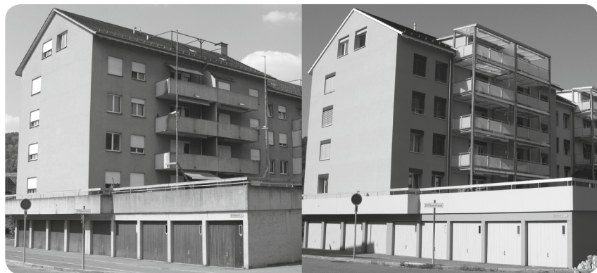
Vor der Sanierung...

Die Liegenschaft in Pfungen im Kanton Zürich, wenige Minuten von Winterthur entfernt, ist seit Juli 2005 im Besitz der ImmoMentum AG. Mit Baujahr 1973 ist das Mehrfamilienhaus im Quartier Vorbruggen in die Jahre gekommen, sodass zum Jahresbeginn ein umfassendes Sanierungsprojekt in Angriff genommen wurde.